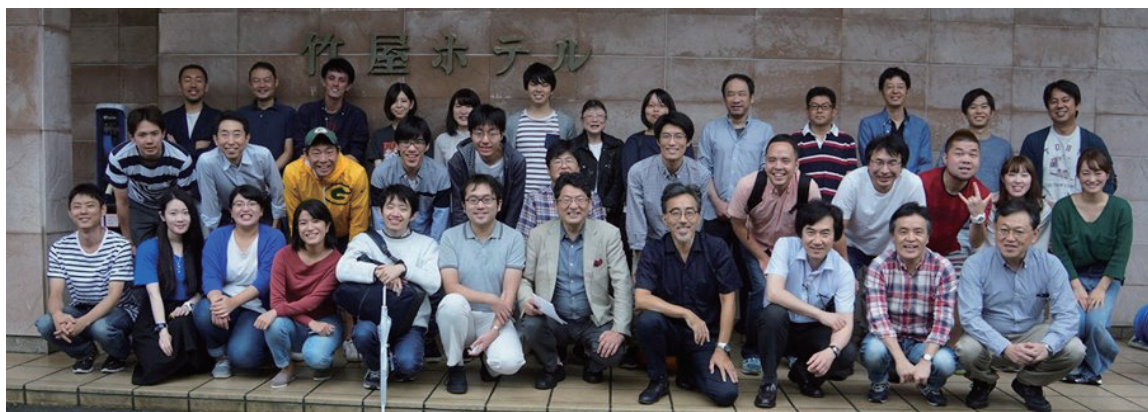
30年9月 研究室（+関連研究者）のリトリート「オルガネラ研究会」（鶴岡）