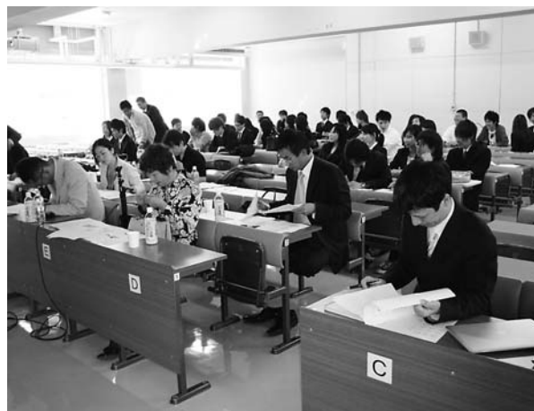
写真2. 政策立案コンテスト当日の風景

予選は10時30分から始め、各団体10分の発表のみで行なった。そして、参加した13の団体のうち、審査員平均点が上位の7団体が本戦に進めることとした。質疑応答を行わなかったのは、質疑応答まで行くと1日では終わらないスケジュールになってしまうからだ。本当は2つの会場を用意して審査員を2人ずつ配置し、各会場からの上位3団体と、敗者復活としての1団体の合計7団体を本戦に出場させる予定だった。しかしこの時期は先生方は学会があり一番忙しい時期であった。審査員をあまり集めることが出来なかったのは反省点である。