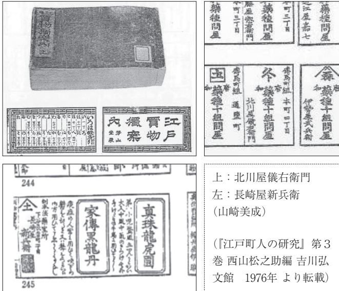
【写真1】『江戸買物独案内』